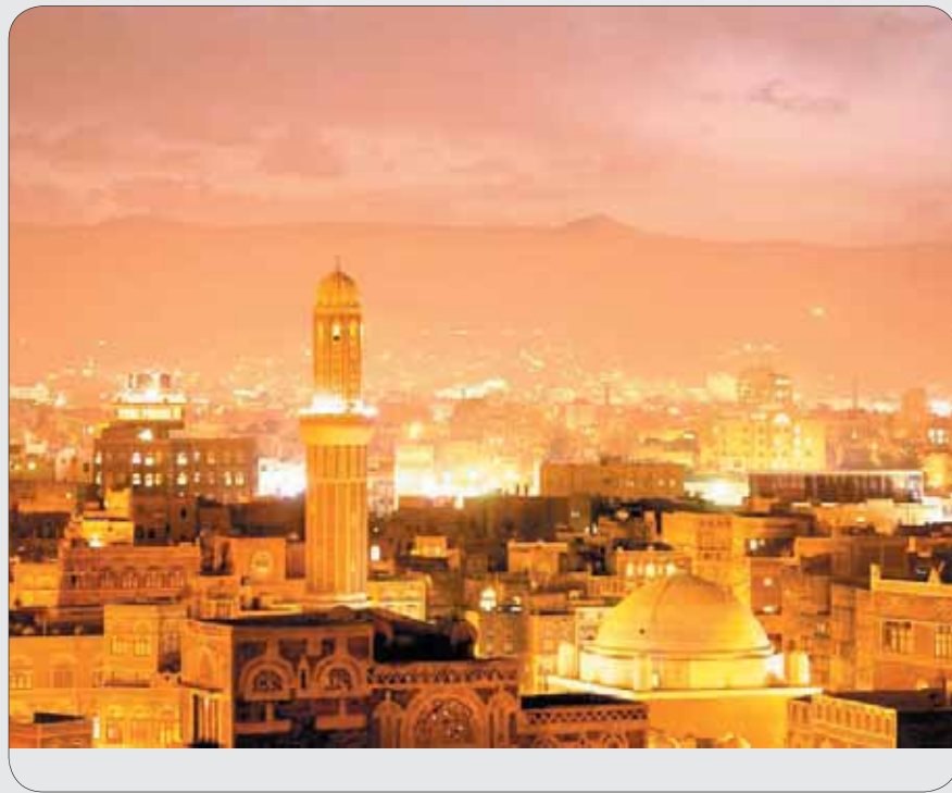
• اجواء صنعاء القديمة الرمضانية والنع رائحة

في أول ليلة رمضانية استيقظنا للسحور وبينما كنا نتناول الطعام سمعنا الأذان...فتوقفنا جميعا وعلى الفور اتصلت بأحد الاقارب وسألته:هل حان أذان الفجر فأجاب ضاحكا : "ان البعض يرفع الاذان بدل التسبيحة ولذلك وصلوا السحور ان باقي على الفجر أكثر من نصف ساعة". طيب يا جماعة نعرف جميعا ان الغرض من الأذان هو التنبيه والإعلان عن موعد الصلاة...وطوال عمرنا - وخصوصا اجواء صنعاء القديمة - نعرف أن هناك ثلاث تسبيحات قبل أذان الفجر... هذه التسبيحات من اجمل واروع الاجواء الرمضانية... فماذا حصل...!!!؟ ولماذا هذه اللخبطة الدينية...!!؟