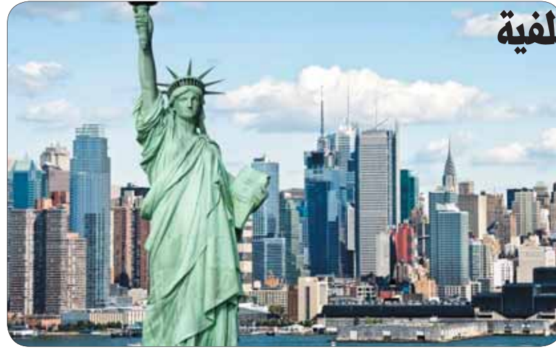
• رغم صخب وزحمة مدينة نيويورك الا انها بدت لنا هادئة ووديعه